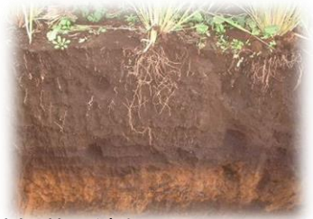
研究A イネの根と菌根菌と遺伝子