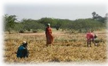
研究B インドとタイの干ばつ