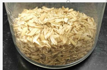
未利用バイオマス 資源