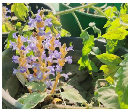
根寄生雑草の防除