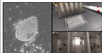
他研究室・企業との連携